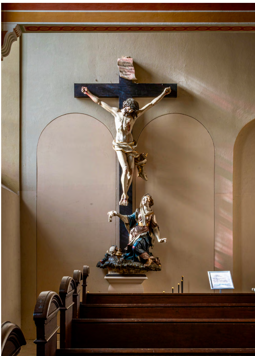
Kreuzifix vor leeren Sitzbänken. Propsteikirche Peter und Paul, Potsdam, März 2025.