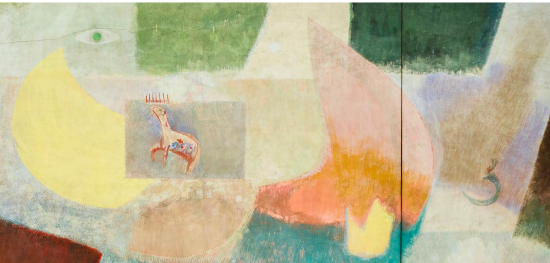
Fotos: Ausschnitte aus dem Altarbild vom Karmel Regina Martyrum, Berlin, Feb 2025. Von John Grantham

Das aus dem Französischen stammende Wort „Mode“ bezeichnet die in einem bestimmten Zeitraum geltende