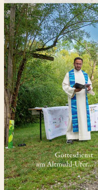
Gottesdienst am Altmühl-Ufer...