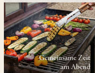
Gemeinsame Zeit am Abend