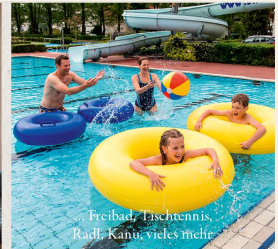
Freibad, Tischtennis, Radt, Kanu, vieles mehr