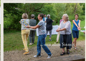
... mit allen Sinnen