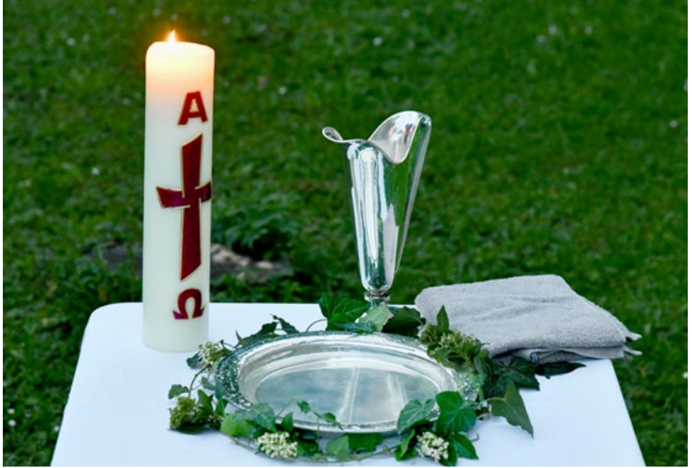
TITELBILD : Pfeffer – Gemeindebrief BILD LINKS: Lotz – Gemeindebrief