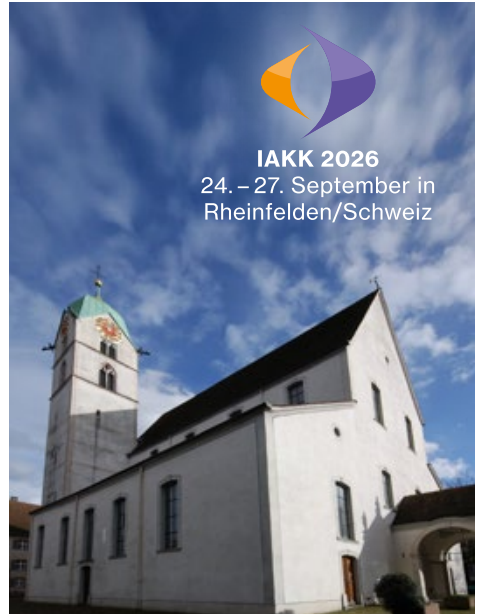
IAKK 2026 24. – 27. September in Rheinfelden/Schweiz

Die Anmeldung über die Webadresse www.christkatholisch.ch/iakk2026 ist ab sofort möglich. Die Kongresskarte, die den Zugang zu allen offiziellen Veranstaltungen ermöglicht und in die alle Apéros, Mittag- und Abendessen während des Kongresses eingeschlossen sind, ist für 150,00 Schweizer Franken (ca. 165,00 €) erhältlich; Tagestickets kosten 50 Schweizer Franken. Hotelkontingente in verschiedenen Preiskategorien sind über die genannte Webseite einzusehen.