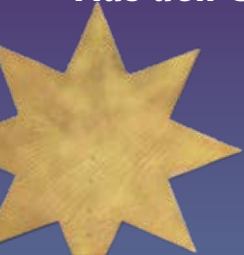
Sternsinger aus Karlsruhe