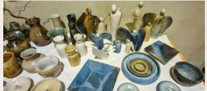
Den Beitrag zum Landauer Kunstbasar finden Sie im Landauer Teil ab Seite 22