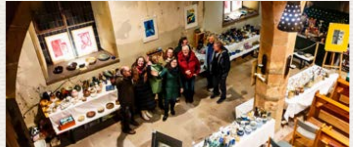
Fleißige Helfer beim Aufbau

Auffällig ist das schmalere Format unseres neuen Briefes. Es ist ein richtig handliches „Jackentaschen-Format“, das uns darüber hinaus hilft, einen erheblichen Betrag der Portokosten zu reduzieren.