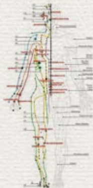
Meridianpunkte, ähnlich der Akupunktur