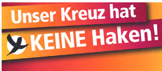
(Plakat der ACK Köln)

Der Kirchenvorstand begrüßt die Erklärung von Bischof und Synodalvertretung und betont, dass unsere Gemeinde ein Ort ist, wo rassistische, antisemitische, queerfeindliche und anders diskriminierende Haltungen keinen Platz haben.