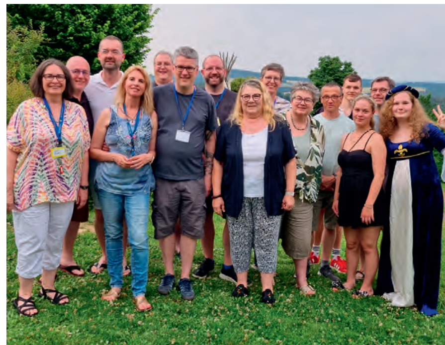
Begegnen und Aufbrechen - Dekanatstage 2024

Der Termin für die Dekanatstage 2025 steht schon fest: Es ist das Wochenende vom 27. bis 29. Juni 2025.