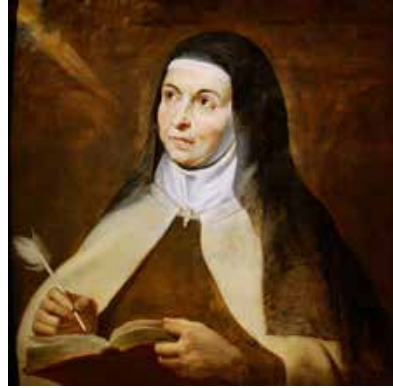
Theresa von Avila, Gemälde von Peter Paul Rubens

Geplant sind eine spirituelle Wattwanderung und verschiedene Workshops zum Motto. Daneben soll aber auch Zeit für Gespräch und Begegnung beim Mittag-