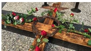
Gründonnerstag und Karfreitag