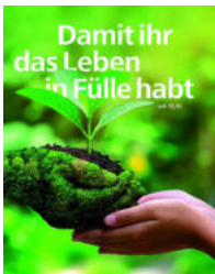
Plakat: ACK in Deutschland