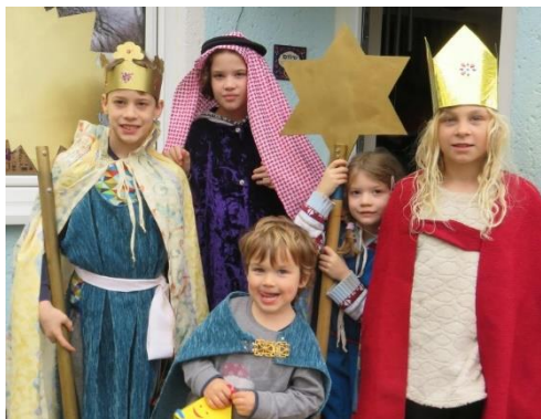
Am 7. Januar waren die Sternsinger unterwegs!