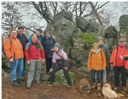
Die Gemeinde geht ihren Weg! Die Neujahrswanderer haben es vorgemacht!