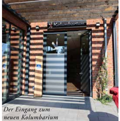
Der Eingang zum neuen Kolumbarium

Die Einsegnung konnte auf Grund der Corona-Pandemie zunächst nur in einem