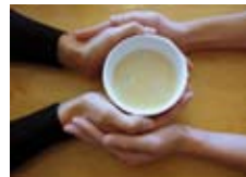
»Da sein«

IBAN: DE58 5206 0410 0000 4029 66 BIC: GENODEF1EK1