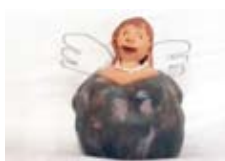
Di 07.12.2021, 18:30 Uhr Stuttgart

Zum dritten Mal wird es am Freitag vor Weihnachten ökumenische Impulse zum Advent geben. Dieses Jahr wieder als gemeinsamer Spaziergang durch unsere Nachbarschaft, die Leonhardsvorstadt. Evangelische, römisch-katholisch, anglikanische und alt-katholische Gemeinden bereiten an unterschiedlichen Orten Impulse und Klangerlebnisse vor. Kommen Sie mit auf einen adventlichen Abendspaziergang. Los geht's um 17:00 Uhr vor dem Kerzengeschäft Seifen Lenz in der Esslinger Straße 24 (Hinweis: Lichtvesper fällt an dem Tag dafür aus).