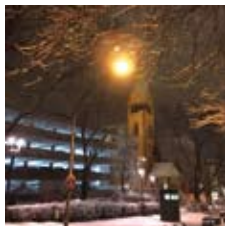
Fr 17.12.2021, 17:00 Uhr Stuttgart