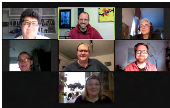
Foto der konstituierenden Sitzung per Zoom am 06. April 2021