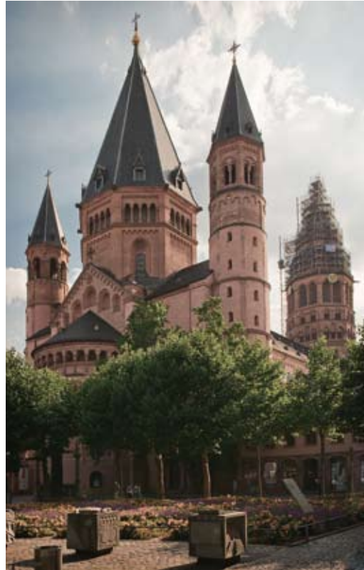
Mainzer Dom

Do 27. - So 30.09.2012 Mainz, Erbacher Hof