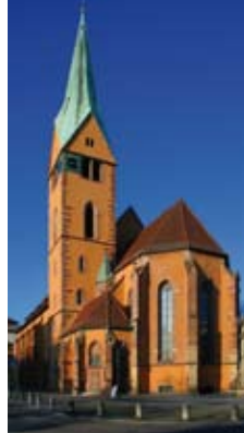
Namensgeberin für das neue alte Viertel: Die Leonhardskirche

Ein wichtiger Schritt im Prozess des Wiederzusammenwachsens ist, die Bewohner der bisherigen Viertel, des Leonhards- und des Bohnenviertels, zusammenzuführen und untereinander bekannt zu machen. Hier haben wir Kirchen uns gern einbinden lassen. Und so sind wir Kirchen es, die zum Nachbarschaftsbrunch am 8.