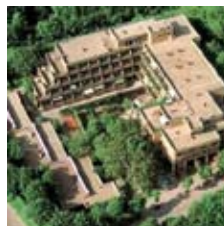
Das Wohnstift Mönchfeld im Fludernweg in Stuttgart

So 04. -Sa 10.08.2019 Mühlbach am Hochkönig