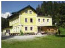
Mitterberghaus in Mühlbach am Hochkönig