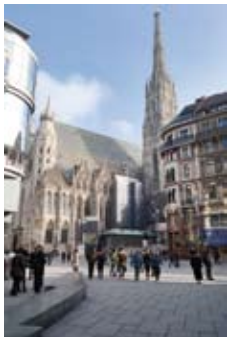
Wien und der Stephansdom: Orte des 32. Internationalen Alt-Katholiken-Kongresses

Do 20.09. - So 23.09.2018 Wien Festsaal des Alten Rathauses, Wipplinger Str. 6-8