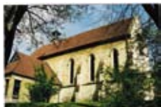
Katharinenkirche vor der Sanierung