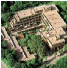
Fr 19.12.2014 S-Freiberg, 15:00 Uhr

Am Freitag, 19. Dezember, sind wir wieder zu Gast im Wohnstift Mönchfeld in Stuttgart-Freiberg. Mit den Bewohnerinnen und Bewohnern des Wohnstifts und Gästen aus der Nachbarschaft feiern wir um 15:00 Uhr die heilige Eucharistie in der Bibliothek des Hauptgebäudes. Der nächste Gottesdienst im Wohnstift wird am Freitag, 27. März, um 15:00 Uhr sein.