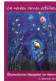
Mo 15.12.2014 19:30 Uhr

»Gott, wenn wir sagen, wir haben keine Schuld, führen wir uns selbst in die Irre, und die Wahrheit ist nicht in uns.« So beginnt eines der allgemeinen Schuldbekennnisse, das in unserem Gesangbuch »Eingestimmt« steht und in der Feier der Versöhnung gesprochen werden kann. Von daher ist es gut, dass wir vor den großen Festen Weihnachten und Ostern Gelegenheit haben, die Feier der Versöhnung zu begehen. In unserer Gemeinde hat es sich bewährt, das in einem eigenen Gottesdienst zu tun – unabhängig von der sonntäglichen Eucharistiefeier. Er findet statt am Sonntag, 21. Dezember, um 9:30 Uhr.