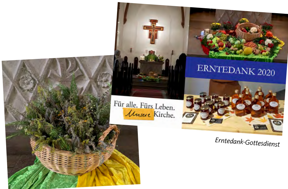
Kräuterweihe am 15. August