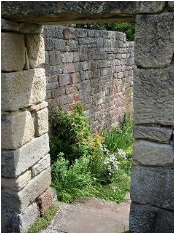
Dekanatstage im Kloster Kirchberg: „SEHEN“