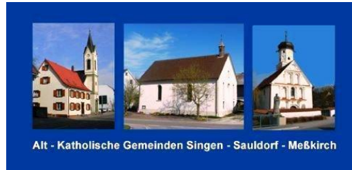
Alt - Katholische Gemeinden Singen - Sauldorf - Meßkirch