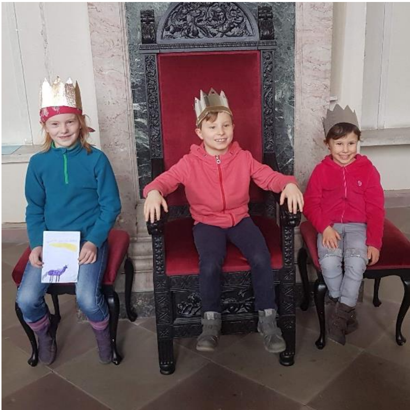
Hoher Besuch in der Schlosskirche