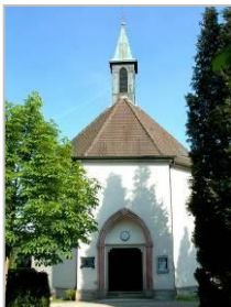
Pfarrkirche ST. PETER UND PAUL

Austraße 14 79713 Bad Säckingen (auf dem historischen Au- friedhof beim Schlosspark)