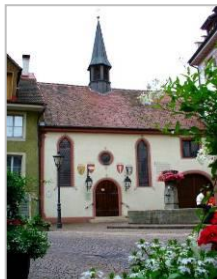
ALTE SPITALKAPELLE HEILIG GEIST

Hier genießen wir die Gastfreundschaft der röm.-kath. Gemeinde Rheinstr. 55 79761 Waldshut