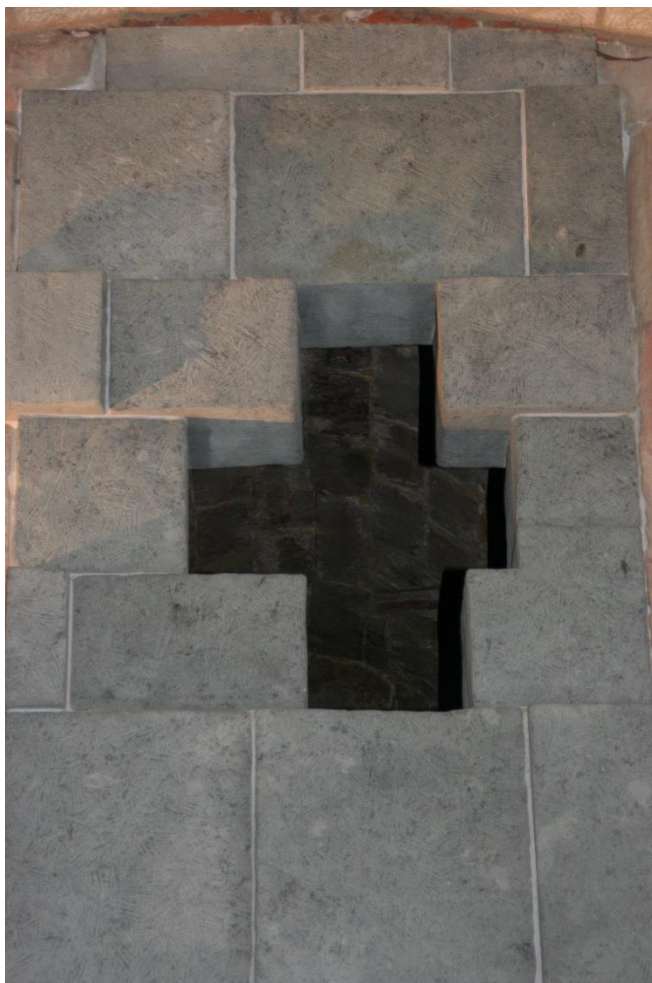
(Detail aus der Krypta der Frauenkirche in Dresden)

der Katholischen Pfarrgemeinde der Alt-Katholiken Hochrhein-Wiesental – St. Peter und Paul