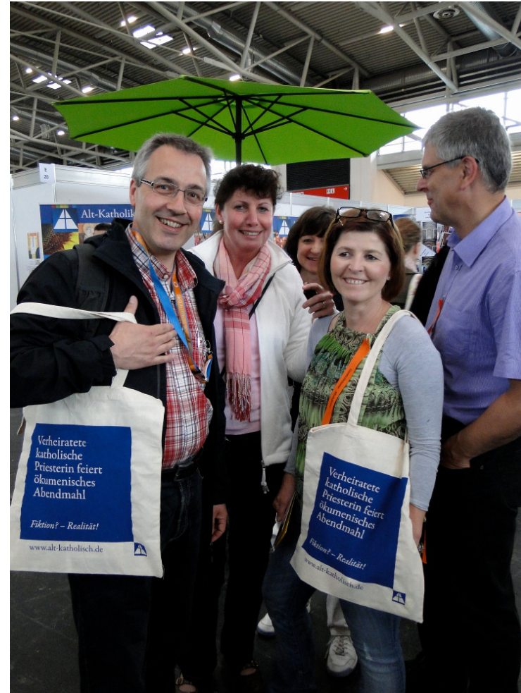
Auf dem Ökumenischen Kirchentag in München