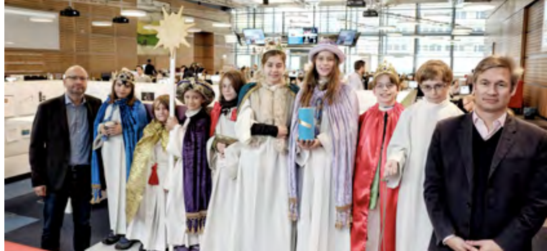
Sternsinger bei der Welt-Redaktion.